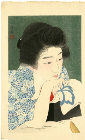
Morgendliches Haar, Torii Kotondo (1900–1976), Farbholzschnitt, 29,5 × 48 cm, Japan, November 1931

Häufig sind Bijin-ga, „Schöne Frauen“ der Künstler Hashiguchi Goyo, Torii Kotondo und Ito Shinsui oder die beeindruckenden Landschaften des berühmten Shin hanga Künstlers Kawase Hasui auf den Drucken zu sehen. Es ist jedoch weniger das Motiv als vielmehr die Bildsprache, worin sich die Neuen Holzschnitte von ihren traditionellen Vorgängern, den Farbholzschnitten des Ukiyo-e, unterscheiden.