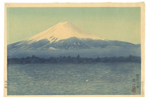
Der See Kawaguchi , Watanabe Shozaburo (Kako) (1885–1962), Farbholzschnitt, 43 x 29,2 cm, Japan, Frühjahr 1937

Bitte tragen Sie im Museum und während der Führung eine FFP2-Maske oder einen medizinischen Mundschutz.